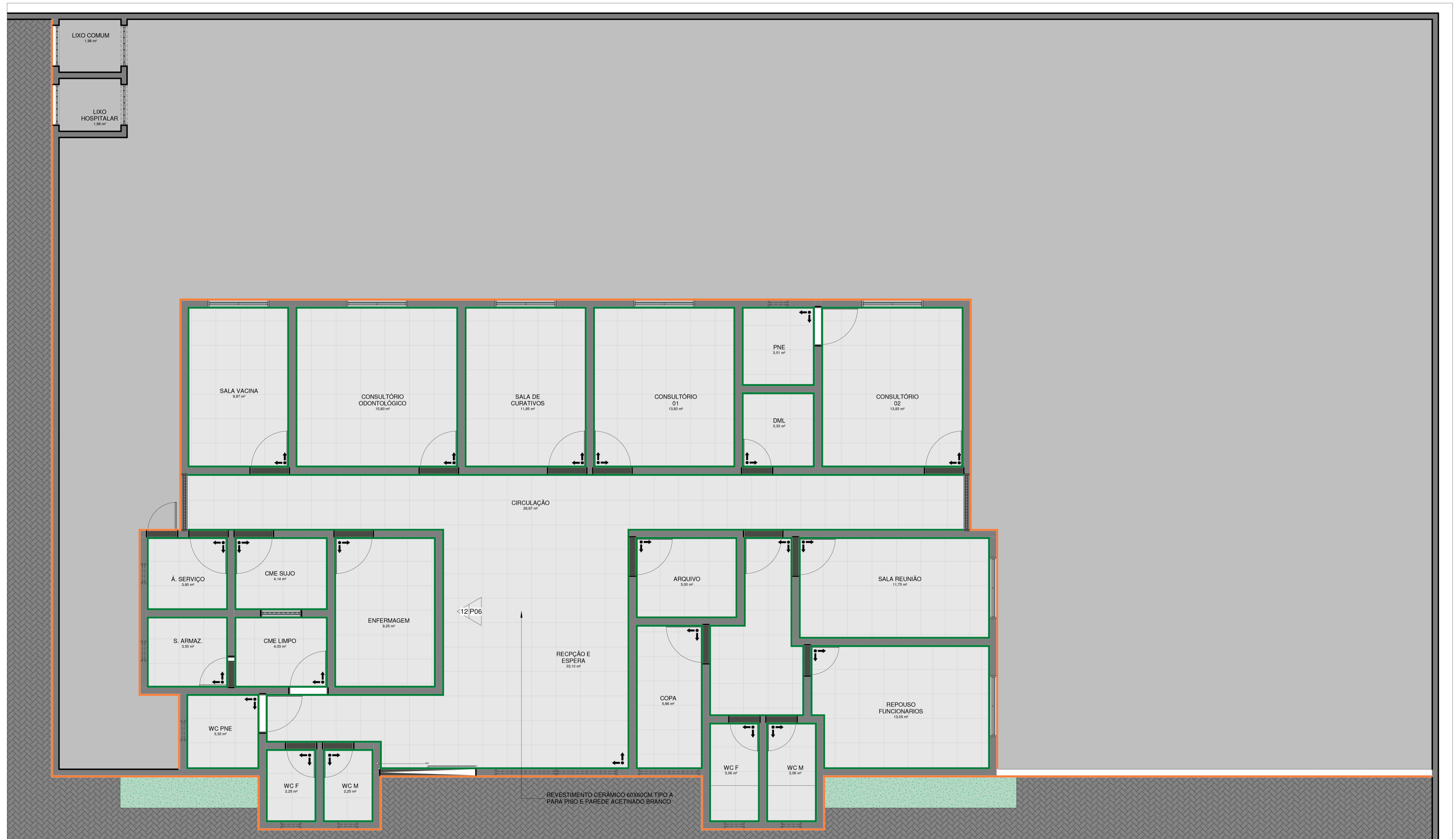
11 PLANTA PAGINAÇÃO DE PISO ESCALA 1 : 50